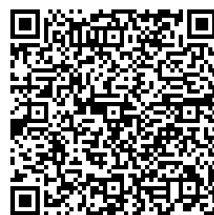
ร่างระเบียบสหกรณ์