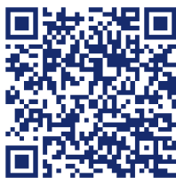
หนังสือกรมส่งเสริมสหกรณ์ ที่ กษ 1115/3493